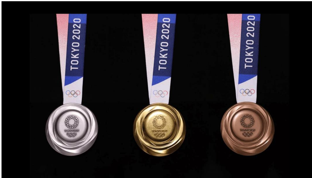
5. kép - A tokiói olimpia érmei a fenntarthatóság jegyében készültek