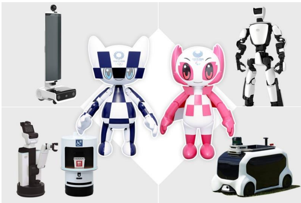
6. kép - Az olimpiát segítő robotok

A T-HR3 humanoid és a T-TR1 robotok célja, hogy eljuttassák a játékokat azokhoz, akik fizikailag nincsenek jelen a helyszíneken. A robotok távolabb található robotok irányába való képek és hangok továbbításával biztosítják az élményt a nézők számára. A FSR robotok az olimpiai dobóeseményeken segítik majd a szervezők munkáját, hogy navigációjuk segítségével csökkentsék a kalapácsok, gerelyek összeszedésére szükséges időt. 42