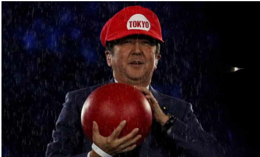
3. kép - Abe Shinzō a 2016-os riói játékok záróünnepségén