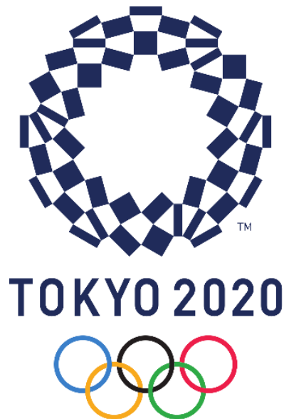
1. kép - A 2020-as tokiói játékok logója

sokszínűséget. 2 Az olimpiai játékok másik fontos emblémája a kabalafigura. A japán tervezők a Miraitowa nevet adták a szintén indigókék figurának. Miraitowa személyiségét a „tanulj a múltból és dolgozz ki új ötleteket” japán mondás ihlette, különleges képessége pedig a teleportálás. Neve is hűen tükrözi az általa jelképezett valóságot: a mirai szó jelentése jövő, a towa pedig örökkévalóság, amelyek ötvözete azt a kívánságot képviseli, hogy a tokiói olimpiai játékok mindenkit az örök remény jövőjéhez vezetnek a világon. 3