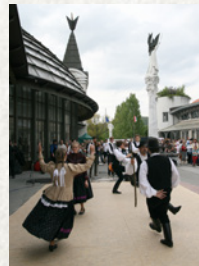
Pilisi majális (2008)