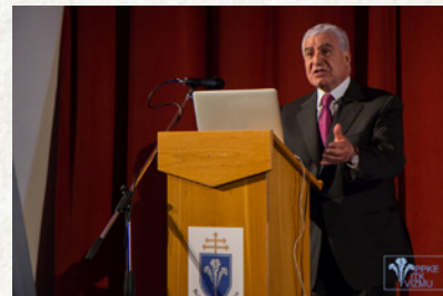
Zahi Hawass előadása (2015)