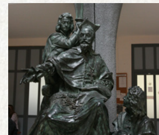
Pázmány-szobor az Ambrosianumban