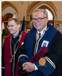
Krzysztof Zanussi díszdoktorrá avatása (2013)