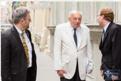
John Lukacs látogatása (2015)