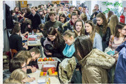
Nyílt nap (2017)