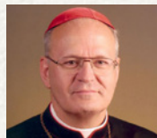
S. Em. R. Prof. Dr. Erdő Péter 2005 – 2015