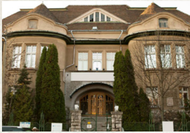
Budapest, Tárogató út