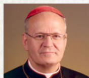
S. Em. R. Prof. Dr. Erdő Péter 1998 – 2003