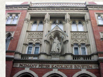
Budapest, Szentkirályi u. 28.