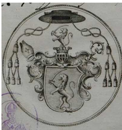
Sélyei Nagy Ignác püspöki címere