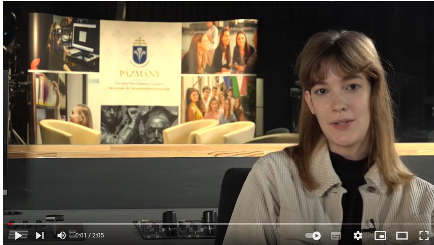
Kommunikáció- és Médiatudományi Intézet Film és Videó szakirány

https://www.youtube.com/watch?v=PFuE00GFNLk&t=11s