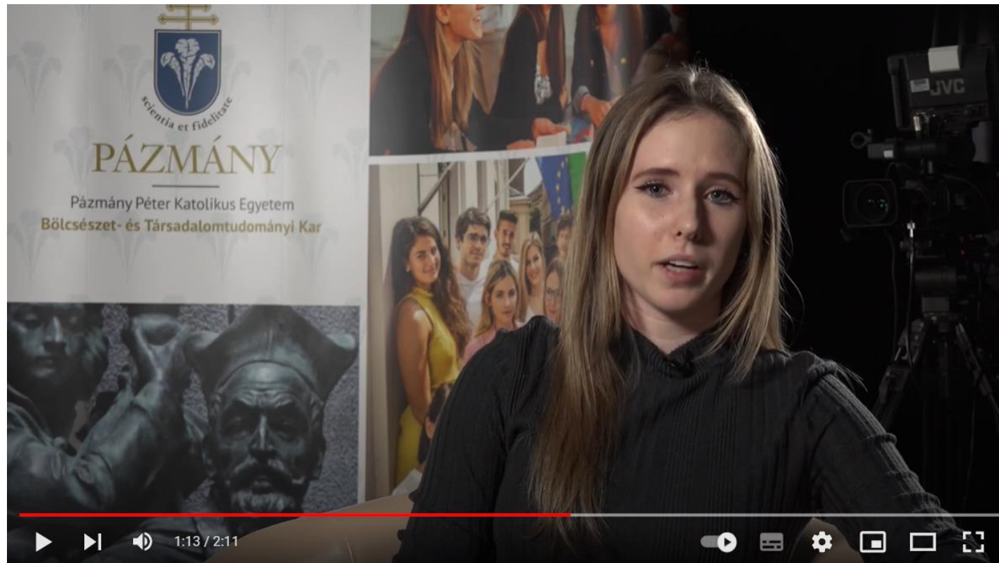
Kommunikáció- és Médiatudományi Intézet Közkapcsolatok (PR) szakirány

https://www.youtube.com/watch?v=rj95MDIXFR0&t=28s