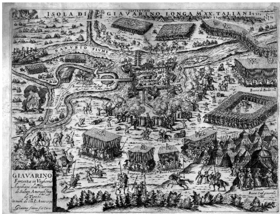
2. ábra: Giavarino fortezza in Ungheria assediata dall'esercito del Sultano Amorath imperatore de' Turchi, in numero di 200 mila l'anno 1594. A török sereg által elfoglalt Győr várának perspektivikus látképe, Giacomo Franco 1594-es rajza papíron, 52 × 37cm. ASMo, Mappario estense, Serie militare, n. 126.

Komoly esztétikai értékkel bír az 1595-ben a török uralom alól felszabadított Visegrád ostromát ábrázoló színes akvarell (5. ábra).