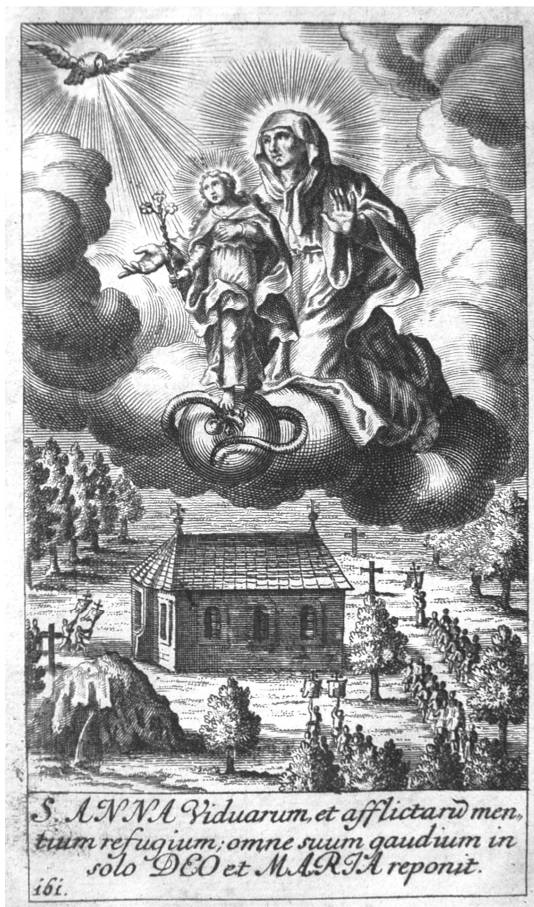
Szent Anna, az özvegyek és szerencsétlenek menedéke, minden örömét Istenbe és Máriába helyezi

talanoknak gyermeket nyer”, „a szülőket megsegíti” „a megbódult lelkiismeretet megvilágosítja”, „a tisztaságot megőrzi”, „a halálra váltaknak megerősítője”, „a halálban lévőket megsegíti”, „megoltalmazza az ellenségektől környülvettetteket”, „a tengeri veszedelemben lévőket életben tartja”, „a halottakat föltámasztja”, „az őtet tisztelőket az örök életben jutalmazza, ellenben a hálátlanok az Istentől megbüntettetnek”.