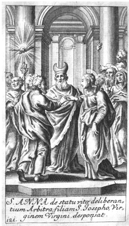
A Szent Anna az ő legtisztaságosb szűz leányát eljegyzé Józsefnek