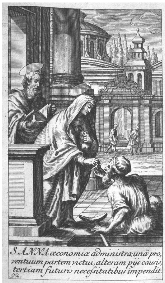
A Szent Anna az ő jószágának jövedelmét három részre osztá