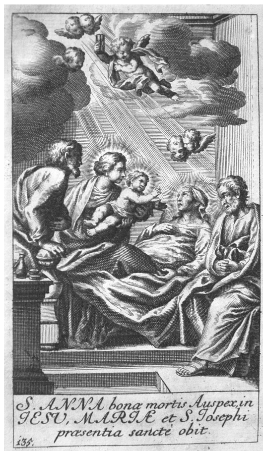
A Szent Anna szentséges haláláról