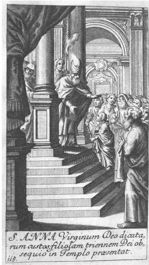
A Szent Anna Máriát a templomban fölviszi, és Mária az Istennek örökös szüzességet fogad