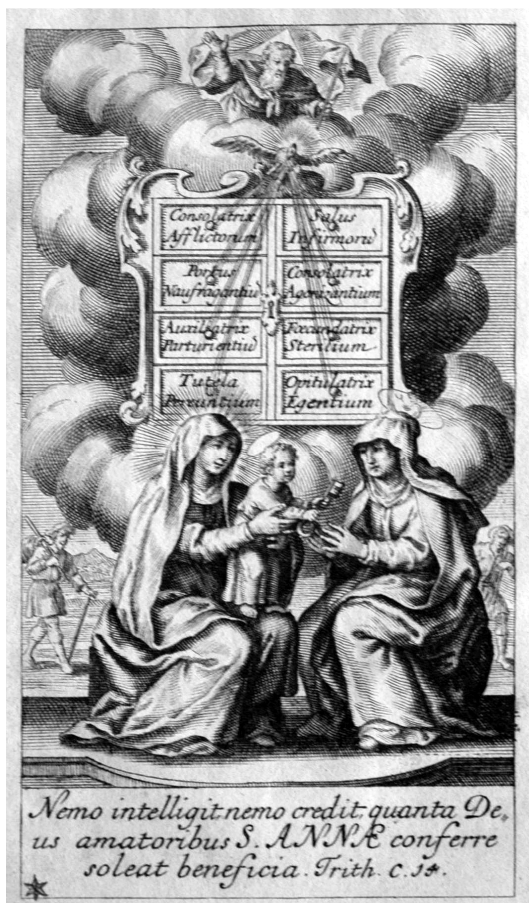
A Szent Annát szeretőket pártfogolja az Úristen

— — — — — Az Isten mindenhatóságának tárháza (Bécs, 1708) Metszet a címlap előtt