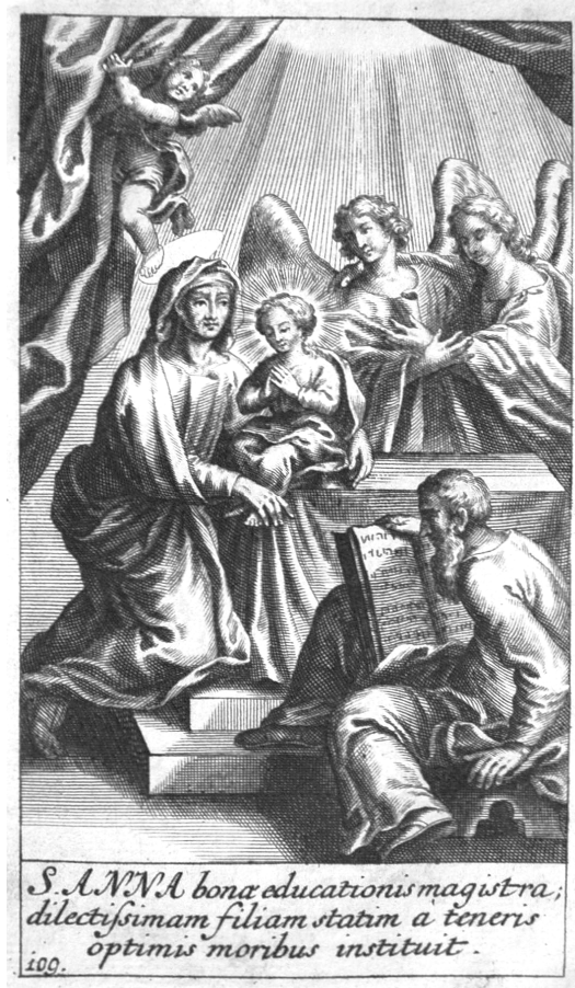
A Szent Anna isteni félelemben neveli szent leányát