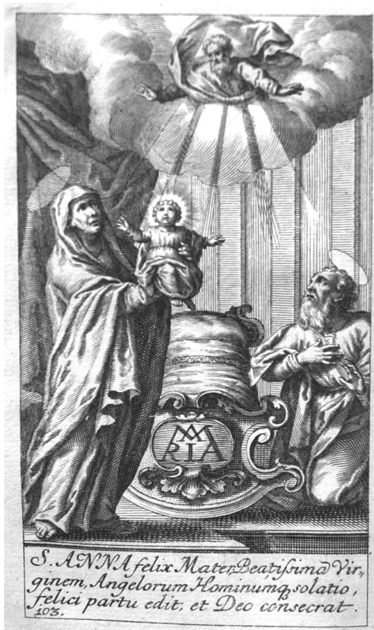
A Szent Anna nagy örömmel szüli az ő makula nélkül fogantatott szentséges leányát