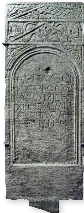
22. kép. Kat.Nr. 40. C. Visius Proculus sztéléje. Stele für C. Visius Proculus (© Landessammlungen NÖ, Archäologischer Park Carnuntum. Fotó: Ortolf Harl)