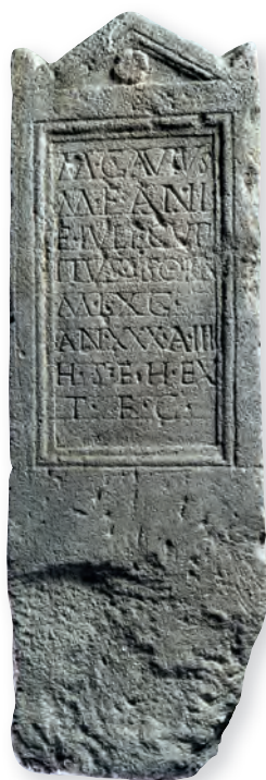
7. kép. Kat. Nr. 16. M. Gavius Cupitus sztéléje. Stele für M. Gavius Cupitus