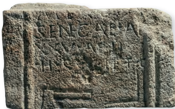
11. kép. Kat. Nr. 27. A legio X gemina egyik katonájának sztélétöredéke. Fragment der Grabstele eines Soldaten der Legio X gemina