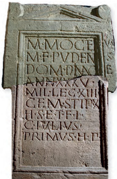
17. kép. Kat. Nr. 34. M. Mogetius Pudens sztléje. Stele für M. Mogetius Pudens