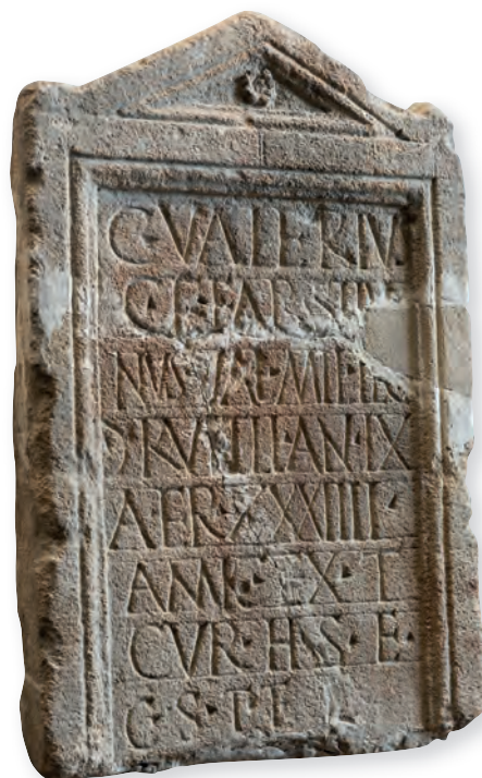
10. kép. Kat. Nr. 23. C. Valerius Silvinus sztéléje. Stele für C. Valerius Silvinus