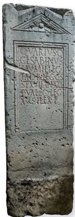
1. kép. Kat. Nr. 1. Q. Varius Sabinus sztléje. Stele für Q. Varius Sabinus