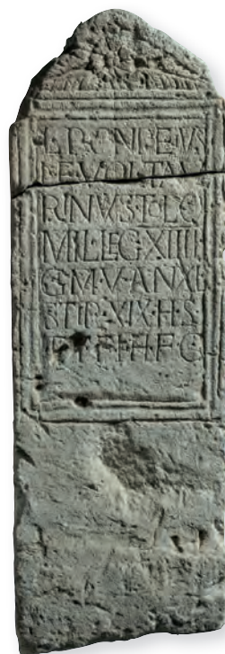
18. kép. Kat. Nr. 36. L. Ponpeius Taurinus. Stele für L. Ponpeius Taurinus