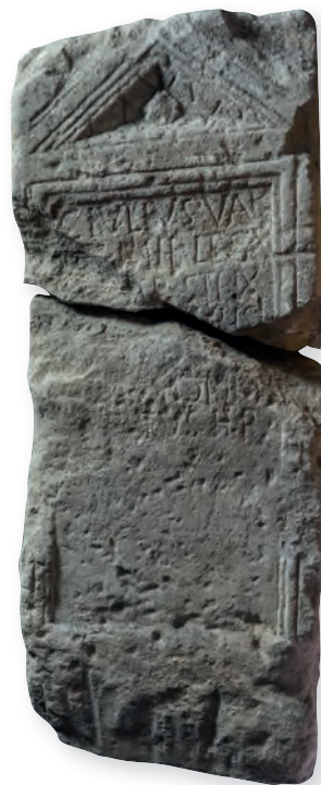
12. kép. Kat. Nr. 29. C. Iulius Valens sztéléje. Stele für C. Iulius Valens