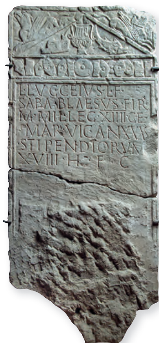
23. kép. Kat. Nr. 41. L. Lucceius Blaesus sztéléje. Stele für L. Lucceius Blaesus