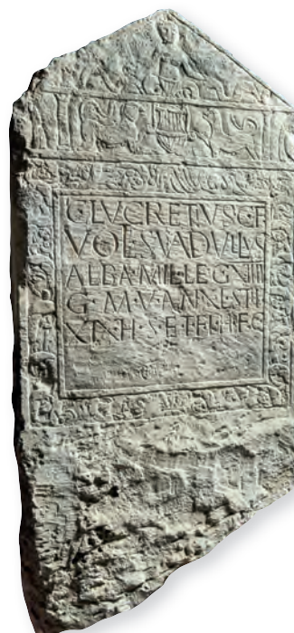
24. kép. Kat. Nr. 42. C. Lucretius Suadullus sztéléje. Stele für C. Lucretius Suadullus