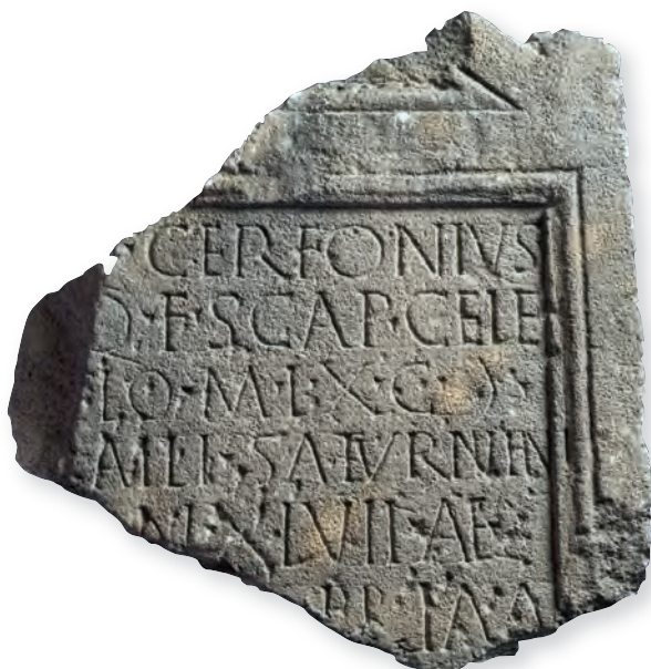
9. kép. Kat. Nr. 20. Q. Cerfonius Celer sztéléje. Stele für Q. Cerfonius Celer