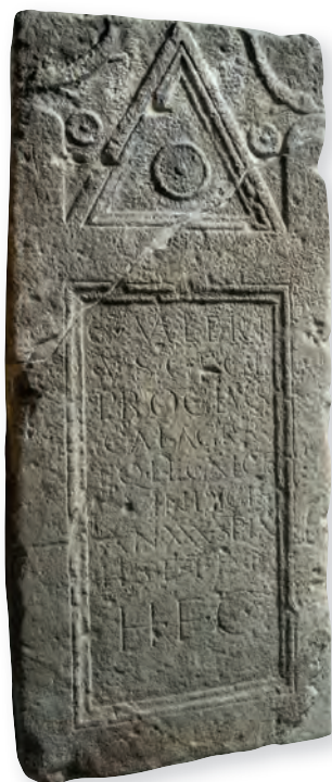
15. kép. Kat. Nr. 32. C. Valerius Proculus sztéléje. Stele für C. Valerius Proculus