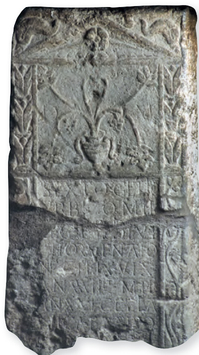
4. kép. Kat. Nr. 6. Sextus Gellius Urbicus sztléje. Stele für Sextus Gellius Urbicus