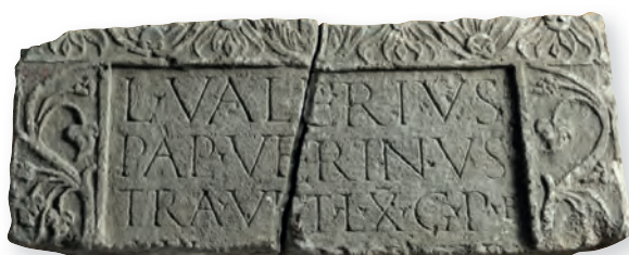
13. kép. Kat. Nr. 30. L. Valerius Verinus sztéléje. Stele für L. Valerius Verinus