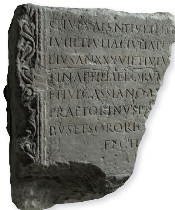
2. kép. Kat. Nr. 3. C. Iulius Valens sztléje. Stele für C. Iulius Valens