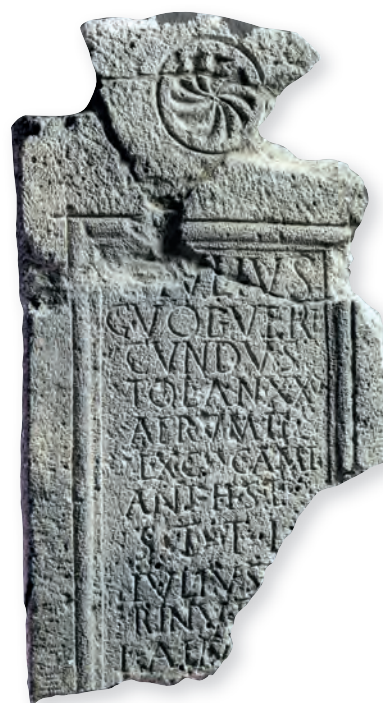
8. kép. Kat. Nr. 18. C. Iulius Verecundus sztéléje. Stele für C. Iulius Verecundus