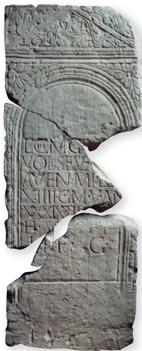
21. kép. Kat.Nr. 39. L. Comagius Severinus sztéléje. Stele für L. Comagius Severinus