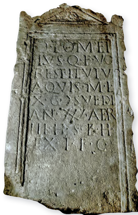
6. kép. Kat. Nr. 11. Q. Pompeius Restitutus sztéléje. Stele für Q. Pompeius Restitutus