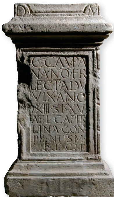
3. kép. Kat. Nr. 5. C. Campanianus sírlátára. Grabaltar für C. Campanianus