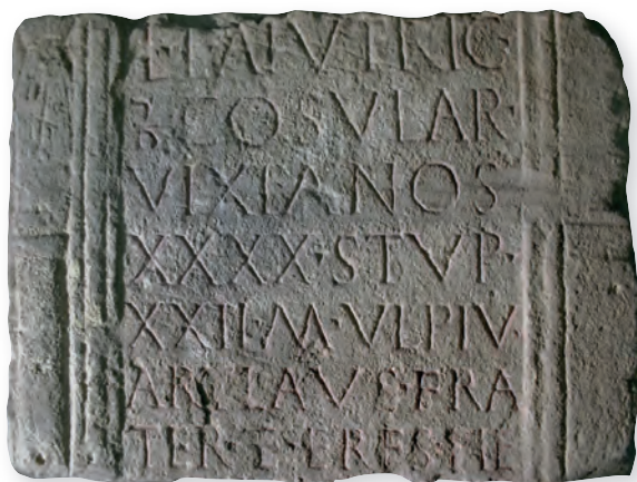
5. kép. Kat. Nr. 8. Beneficiarius sztélétöredéke. Stelenfragment eines Beneficiars