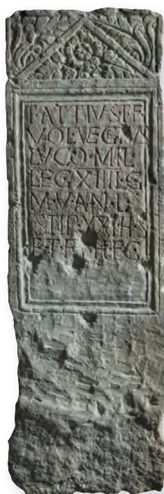
19. kép. Kat. Nr. 37. T. Attius Vegetus sztléje. Stele für T. Attius Vegetus