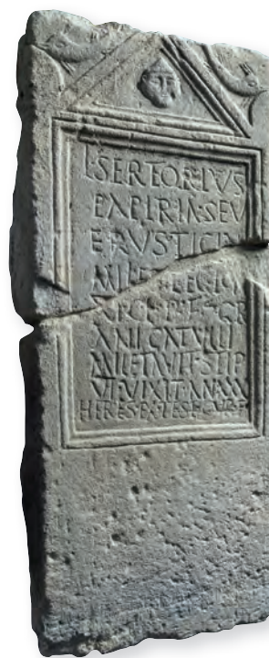
16. kép. Kat. Nr. 33. L. Sertorius Severus sztéléje. Stele für L. Sertorius Severus