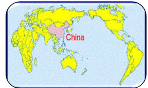
Kínai geopolitikai, stratégiai világtkép