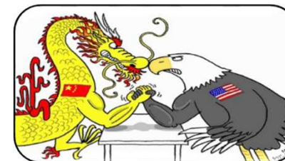
Reális nagyhatalmi viszonyok