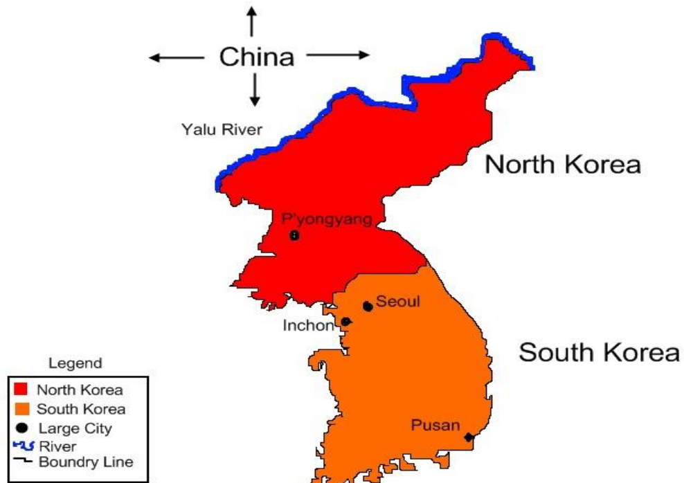
Korea After The War