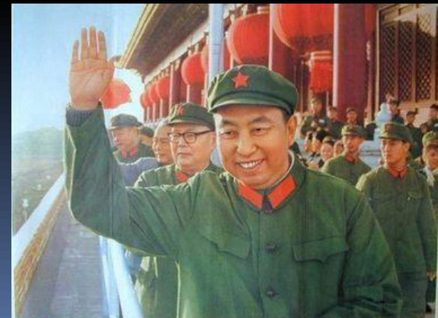
华国锋主席在天安门城楼上向参加庆祝大会的首都百万军民亲切招手致意