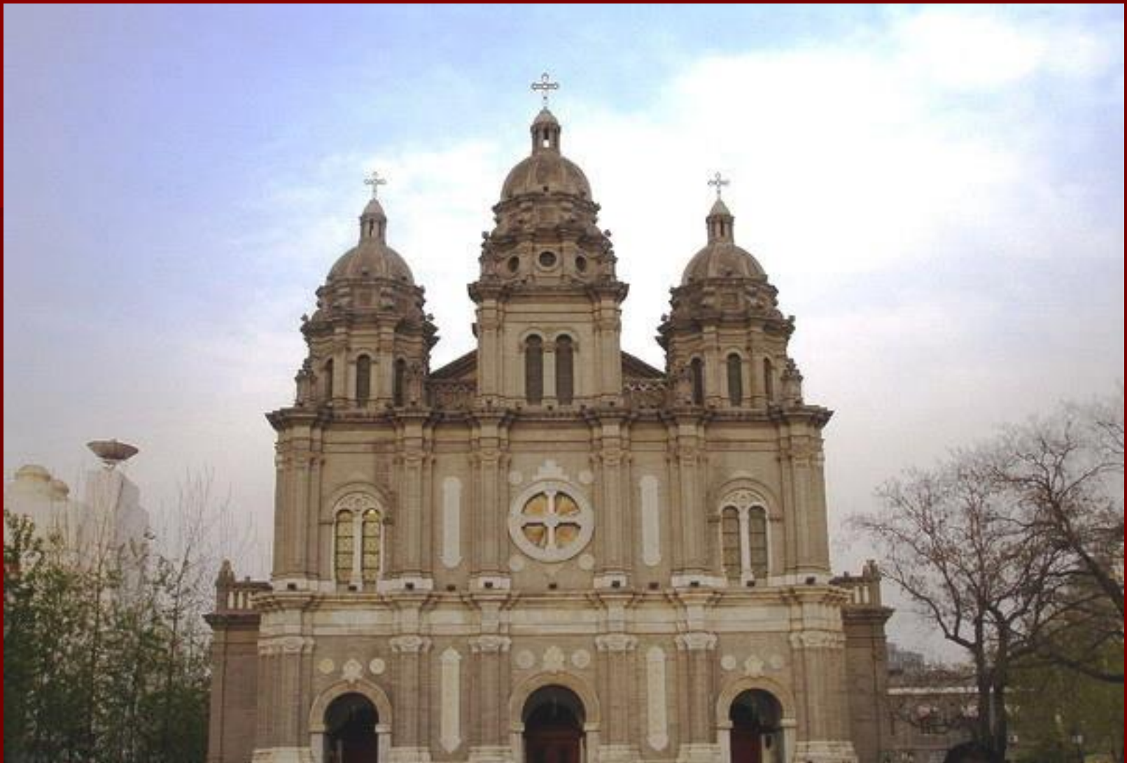
Wangfujing templom (Peking)