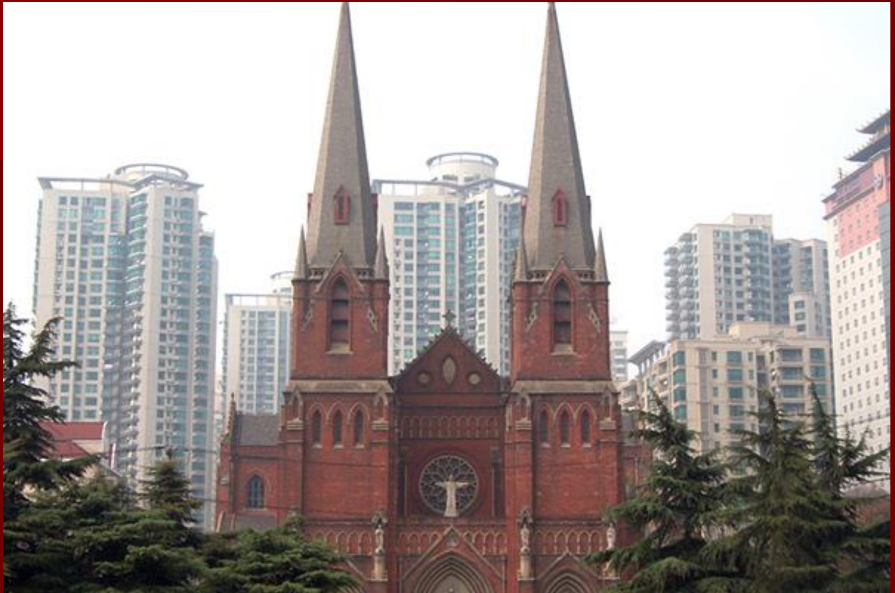
Xujiahui (Szent Ignác) székesegyház, Shanghai