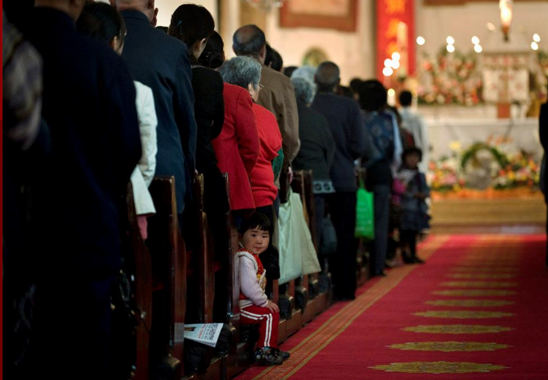
Nantang templom, Peking, 2009 húsvétja