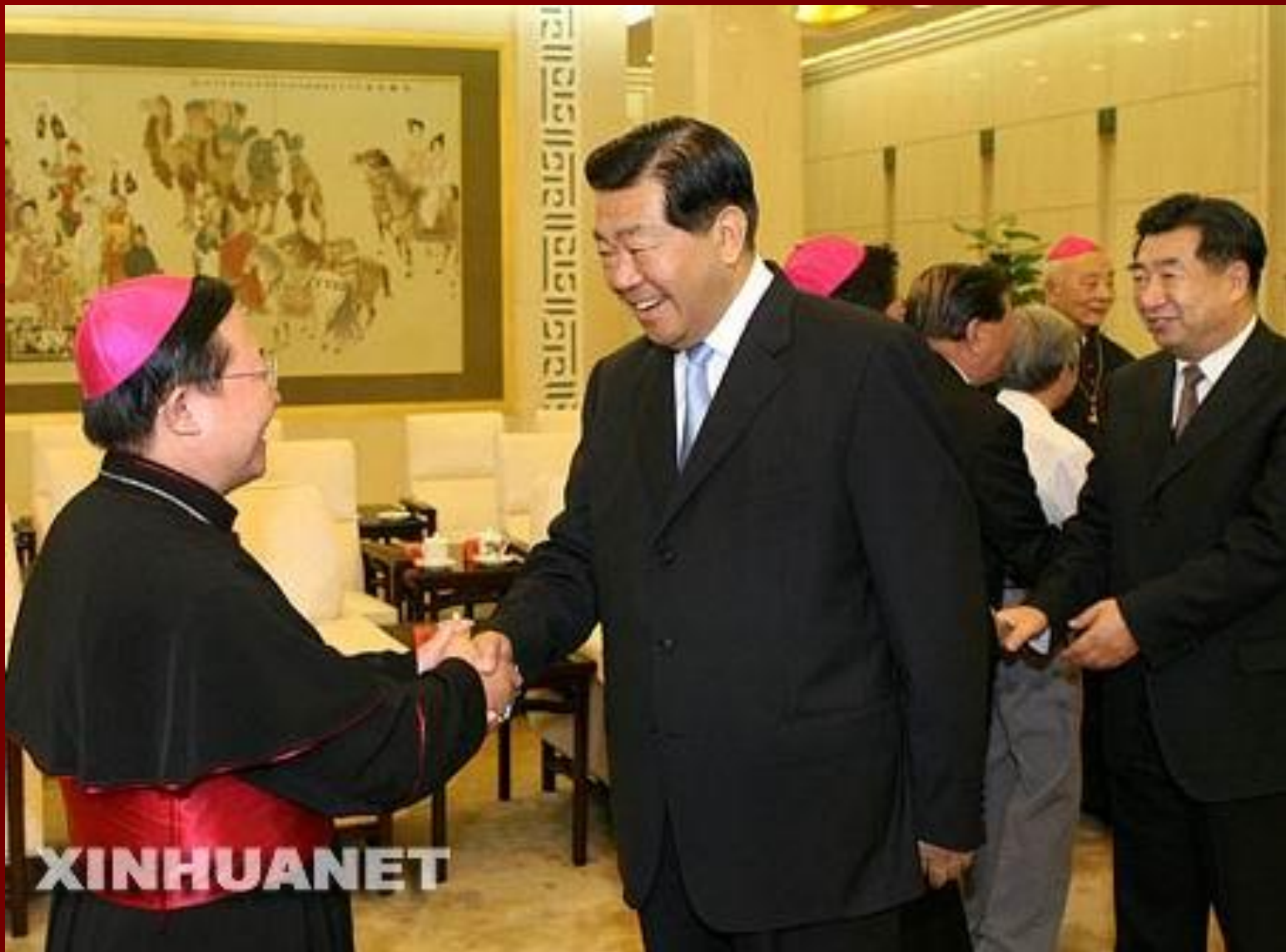
Jia Qinglin a KKHSZ 50. évfordulóján (2007)