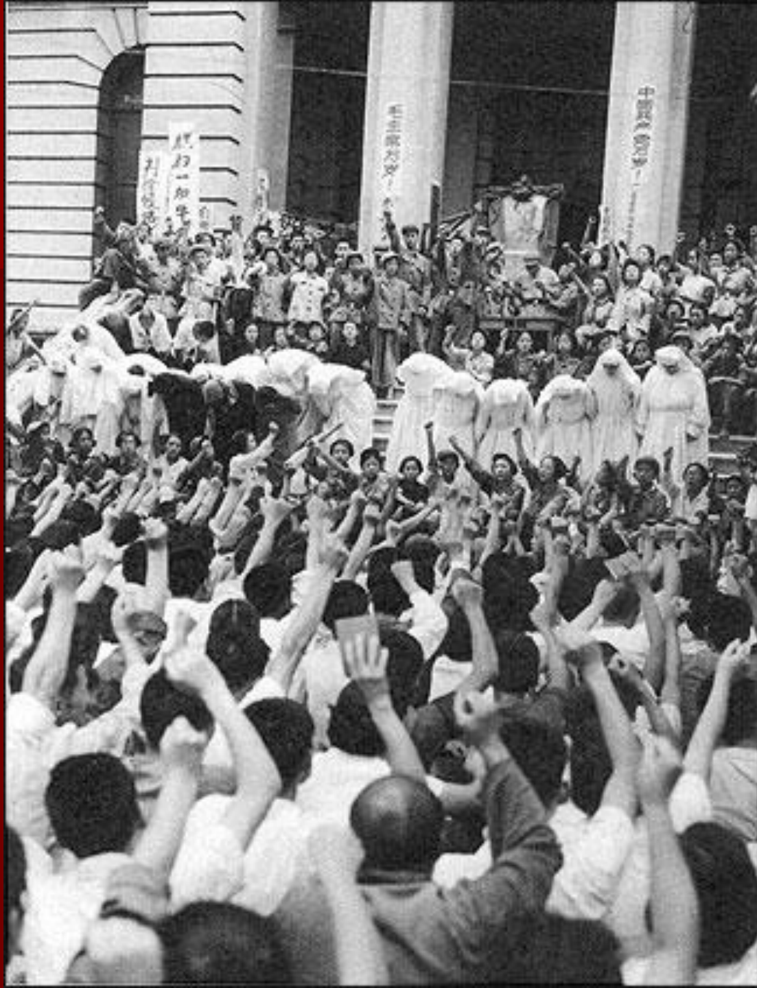
Apácák meghurcolása, 1966. augusztus