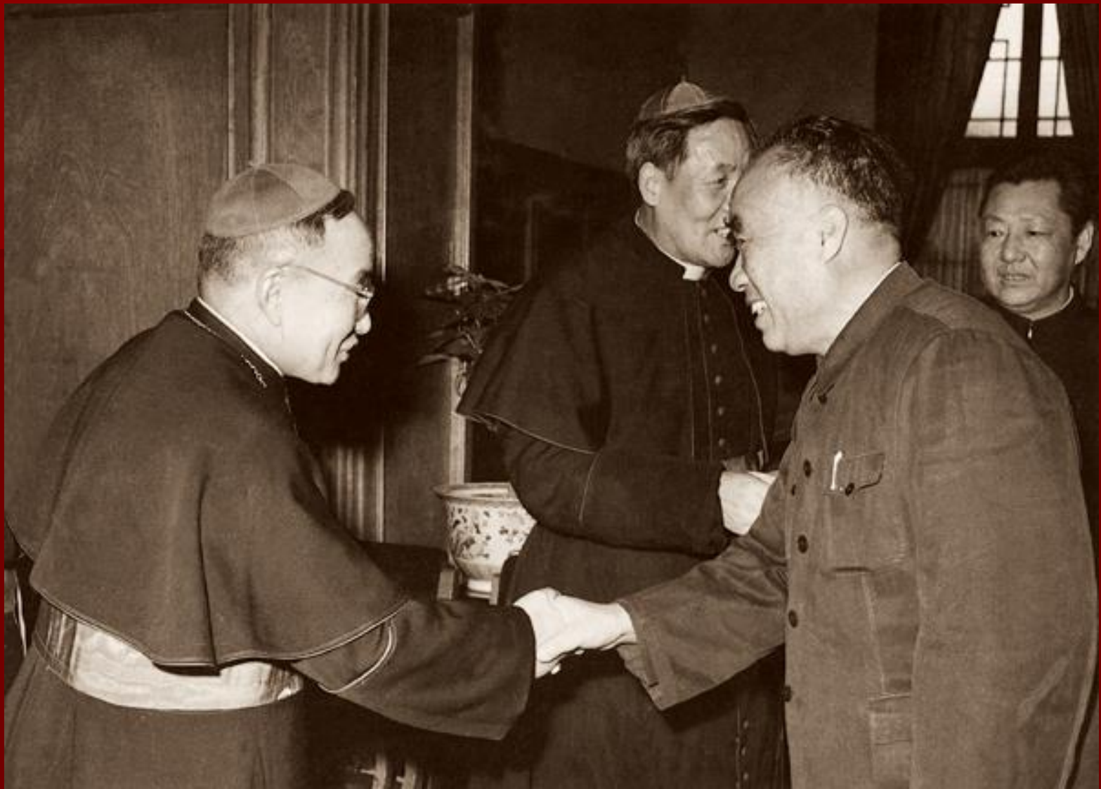
Zhu De és a KKHSZ elnöke, Pi Shushi érsek (1962)