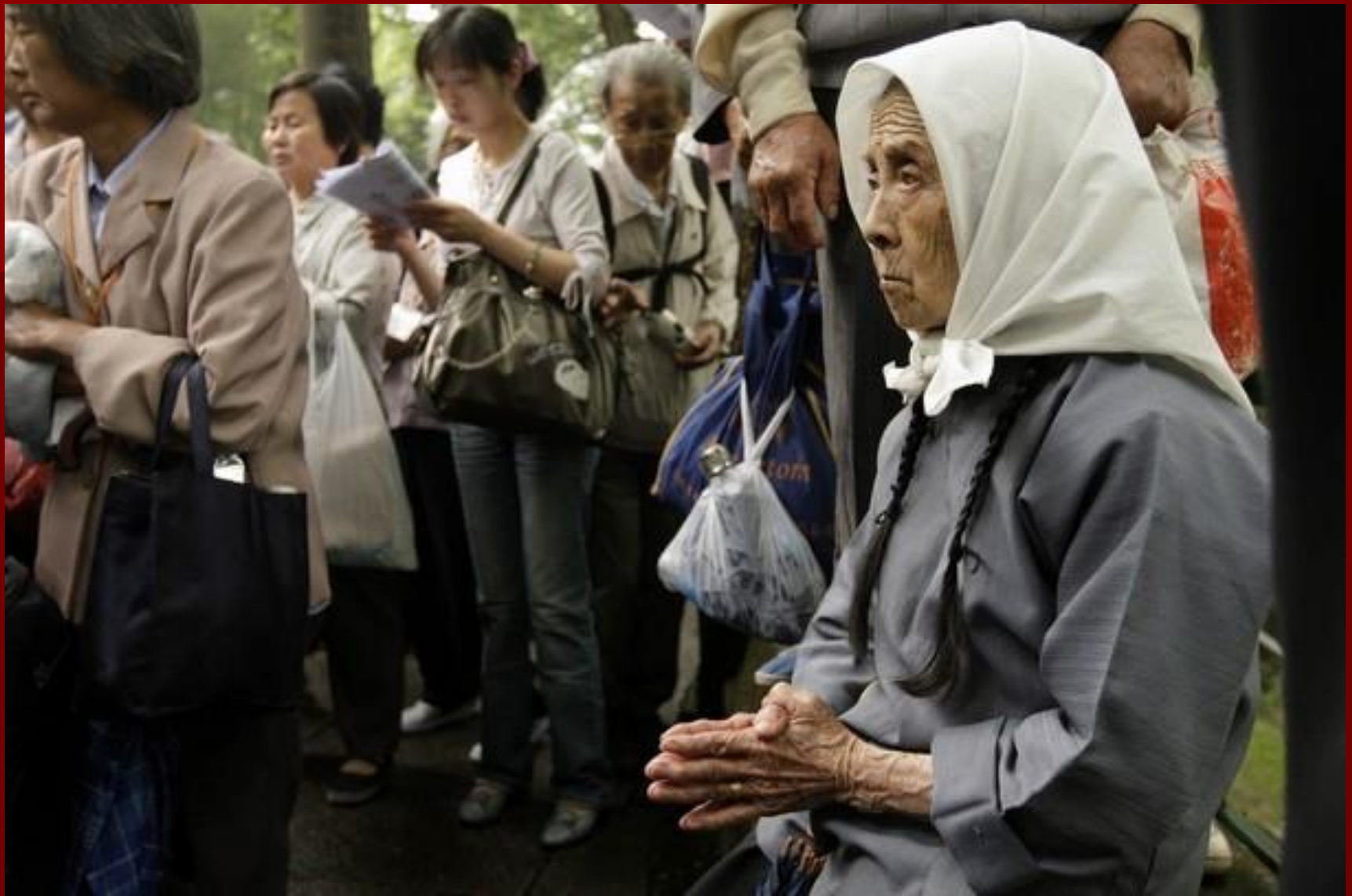
Sheshan Mária-kegyhely, Shanghai