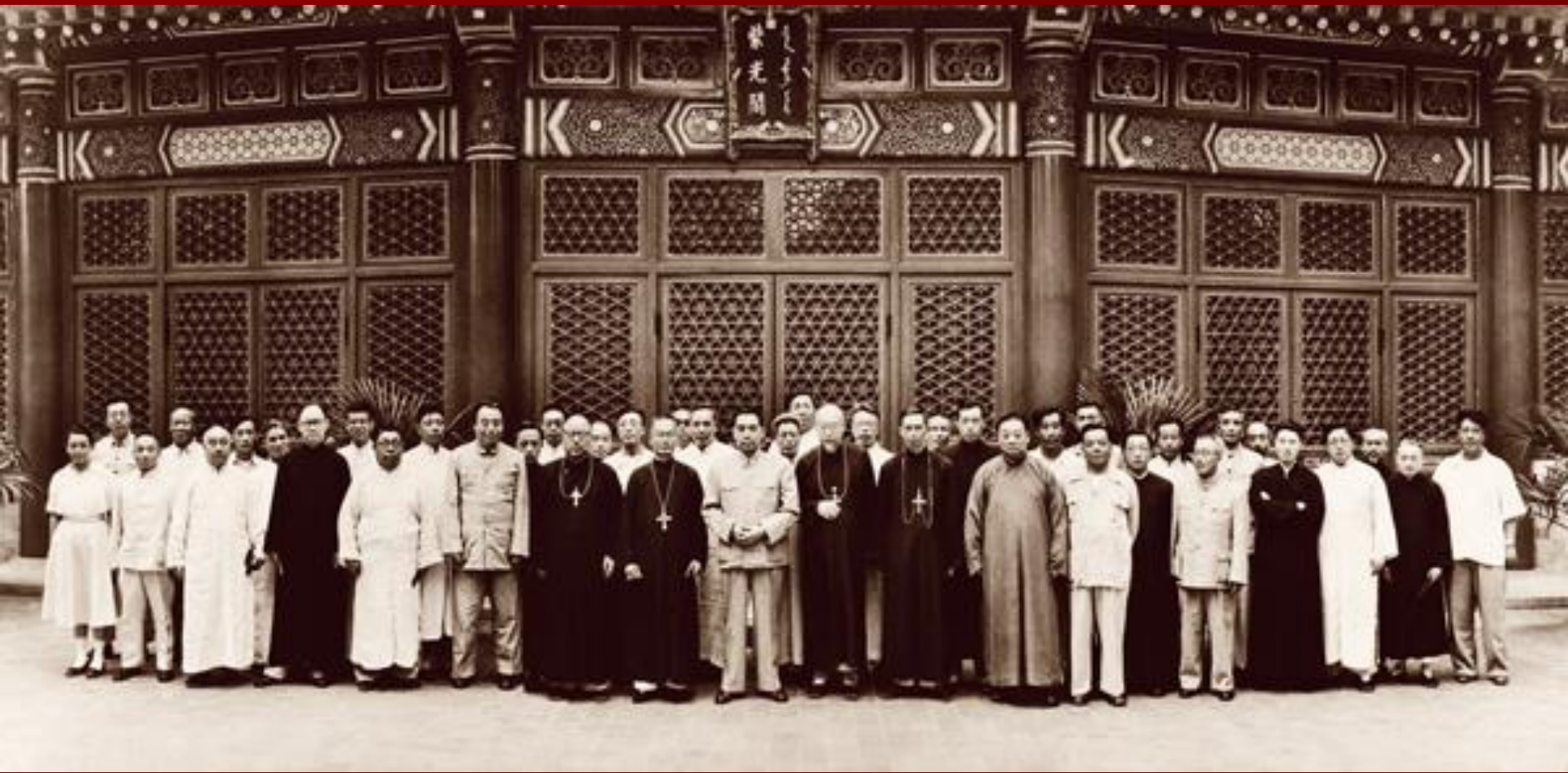
Zhou Enlai és a KKHSZ előkészítő bizottságának tagjai (1956)