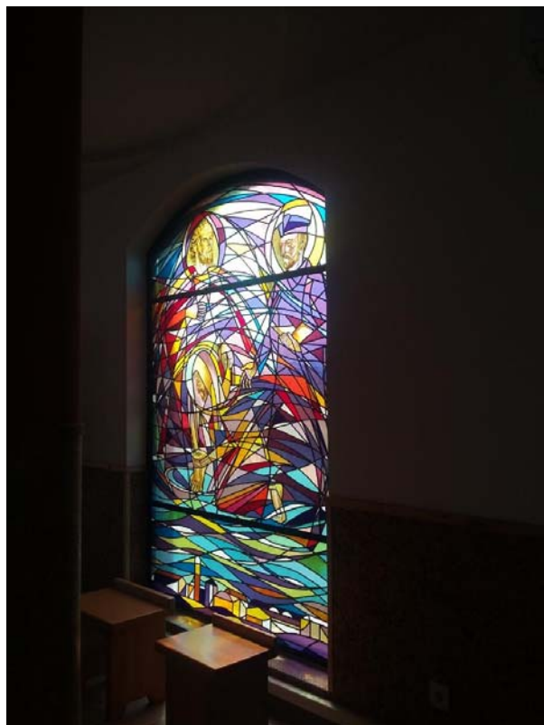
A kollégium kápolnájának üvegablaka