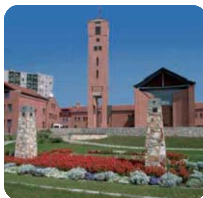
A miskolci Fényi Gyula Jezsuita Gimnázium itáliai városok hangulatát idéző temploma