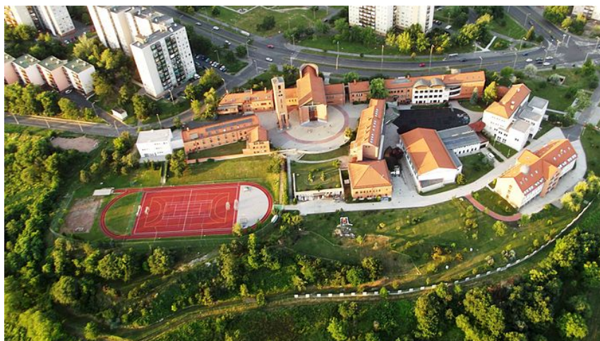
A miskolci Fényi Gyula Jezsuita Gimnázium – az égből nézve

Hegy, templom, lakótelep, iskola. Szemlélődés és befogadás. Csönd és gyerekzsivaj. Tudás és imádság. (Vendég)szeretet.