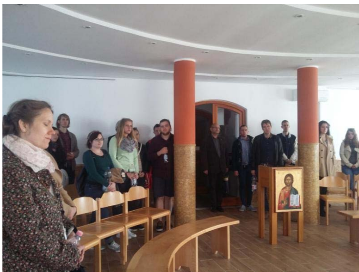
A kollégium kápolnájában

A tanórákon való vendégség után Igazgató Atyával és Igazgatóhelyettes Úrral visszatértünk a gimnázium hivatásáról, lelkületéről szóló beszélgetésünkhöz. Pontosabban e lelkület fókuszához: a szeretetszolgálathoz. A magas szintű oktatást nyújtó iskolában talán minden tantárgynál, minden tudásnál fontosabb a szerető jelenlét a másik ember számára. Egy másik ember valóságában részvétellel töltött idő. Mert csak kapcsolatban létezve tisztulhat teljessé az életünk. Mert