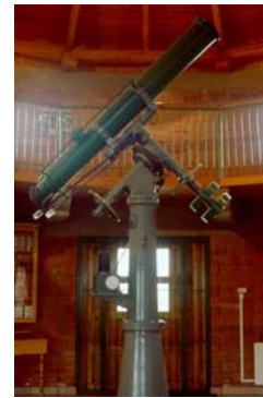
A Fényi Gyula Csillagda távcsöve