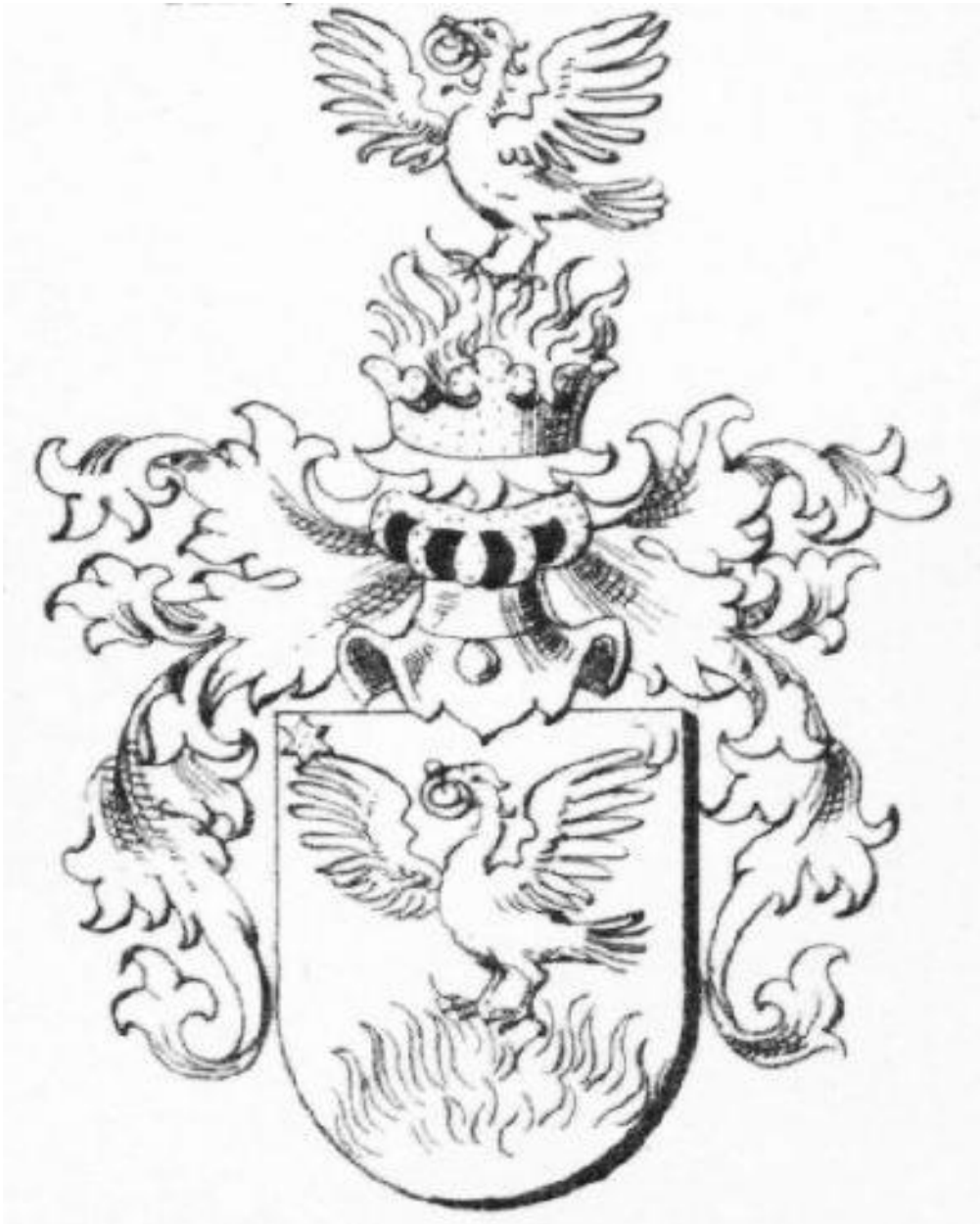
A radováni Keczer család címere 1629-ből 366